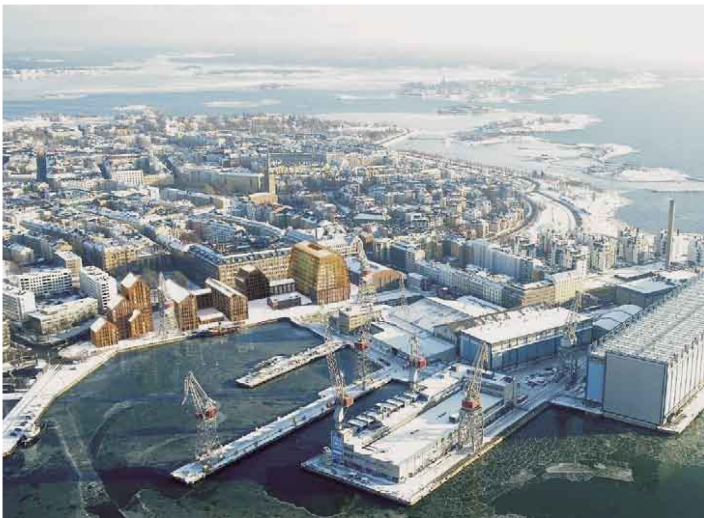
Asemakaavaehdotus rakennettuna: Lundgaard&Tranberg Arkitekter A/S/ Helsingin kaupunkisuunnitteluvirasto