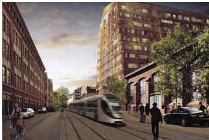
Telakkarannan hotelli: Lundgaard&Tranberg Arkitekter A/S/ Helsingin kaupunkisuunnitteluvirasto