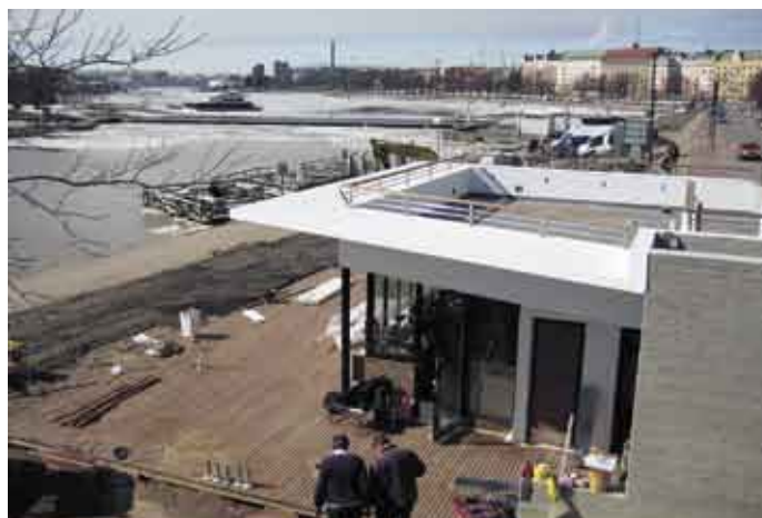
Alkukevästä 2011 rannalle oli nousemassa uusi rakennelma, joka herätti ulkoilijoissa ihmetystä